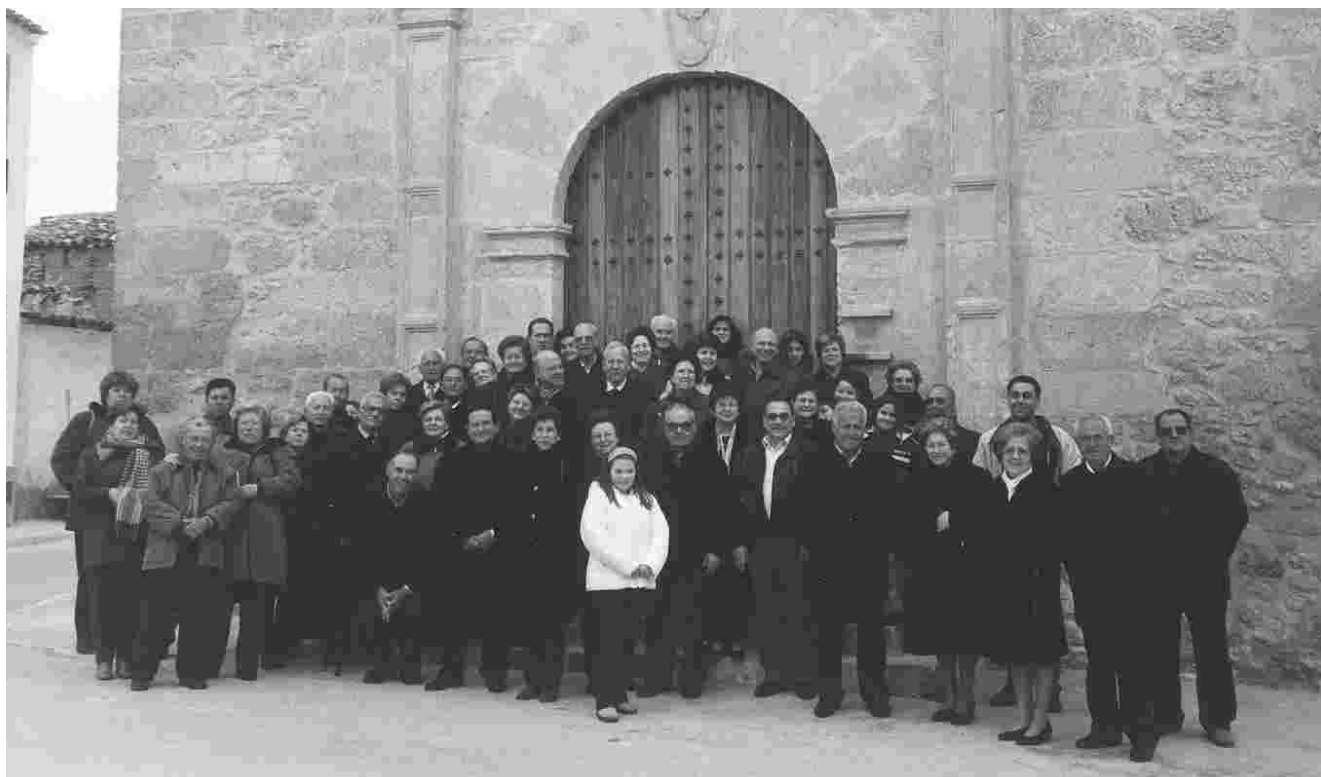
Tal vez, el primer grupo de turistas que como tal visitó Iniesta el 17 de febrero de 2002.

Asociación Cultural Amigos de la Madre Esperanza