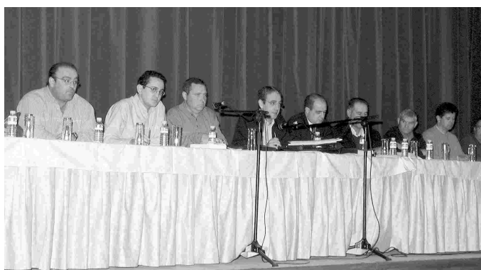
Imagen de la última asamblea de socios.

Por último queremos reseñar y destacar el trabajo que, durante