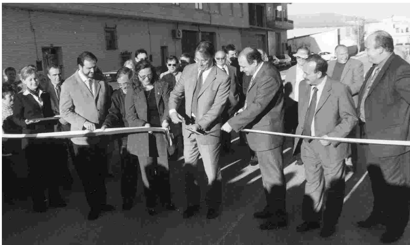
Autoridades cortando la cinta inaugural de la remodelada carretera de Iniesta a Villagarcía.